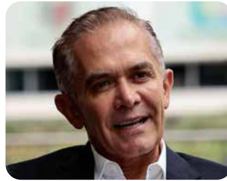
Miguel Ángel Mancera