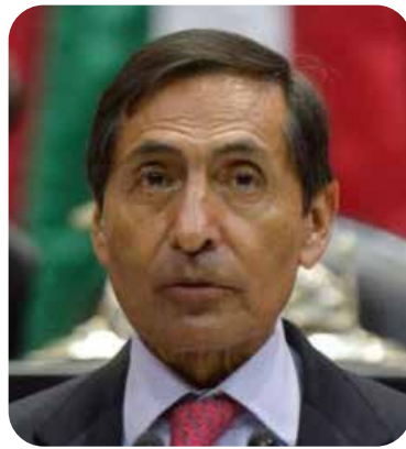
Rogelio Ramírez de la O.