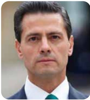
Enrique Peña Nieto