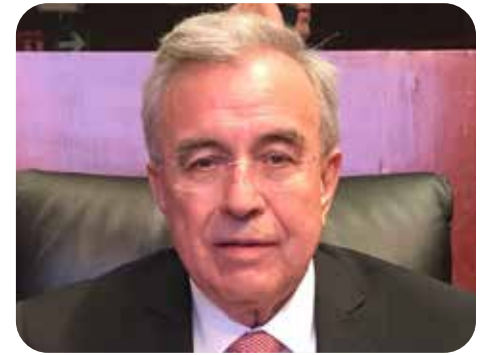
Rubén Rocha Moya