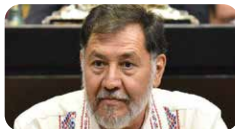
Gerardo Fernández Noroña